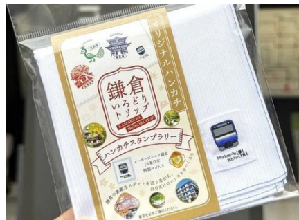
※JR 東日本商品化許諾済

特徴 2 横須賀線を走行する「E235 系」のロゴがあしらわれ、 縁には横須賀線や鎌倉の海をイメージした鮮やかな 青色のステッチが施されています。